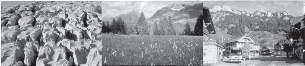
Abb. 1: Zonierung der UNESCO Biosphäre Entlebuch (UBE) (Foto 1: Kernzone: Naturschutzgebiet Schrattenfluh; Foto 2: Pflegezone: Moorlandschaft Habkern/Sörenberg; Foto 3: Entwicklungszone: Dorfzentrum Flühli) Zonation of UNESCO Biosphere Reserve Entlebuch (UBE) (Photo 1: Core Area: nature conservation area of Schrattenfluh; Photo 2: Buffer Zone: moorlands of Habkern/Sörenberg; Photo 3: Transition Area: centre of Flühli) Zonage de «UNESCO Biosphère Entlebuch» (UBE) (Photo 1: Aire centrale: réserve naturelle protégée Schrattenfluh; Photo 2: Zone tampon: Paysage marécageux Habkern/Sörenberg; Photo 3: Aire de transition: centre villageois de Flühli)