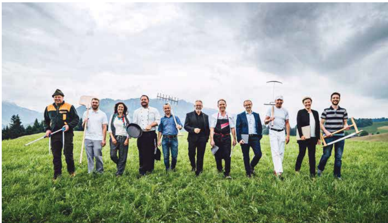
Ohne die Entlebucher Bevölkerung und deren tatkräftiges Mittun gäbe es keine UNESCO Biosphäre Entlebuch.

letztlich ums Überleben geht». Dennoch suchen er und sein Team des Biosphärenzentrums in Schüpfheim stets die Balance zwischen Wirtschaft, Gesellschaft und Natur. Und allem liege die Idealvorstellung der Nachhaltigkeit zugrunde. Diese müsse als Leitprinzip verstanden, gelebt und erlebt werden, sonst taue der Begriff nichts, so Schnider.